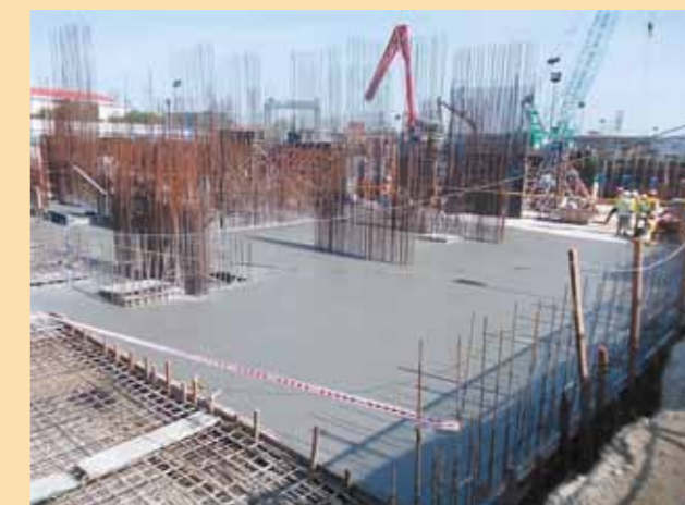
Toàn cảnh tiến độ xây dựng tại Công trình dự án Riviera Point

Email: rp@keppeland.com.vn - www.rivierapoint.com.vn