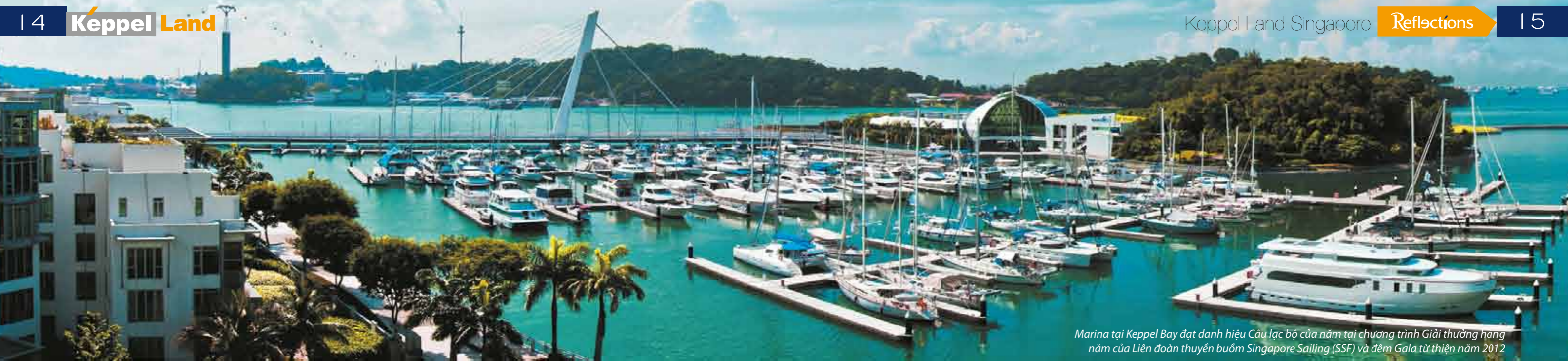
Marina tại Keppel Bay đạt danh hiệu Cầu lạc bộ của năm tại chương trình Giải thưởng hàng năm của Liên đoàn thuyền buồm Singapore Sailing (SSF) và đêm Gala từ thiện năm 2012

triển và xây dựng, về việc đảm bảo quyền và lợi ích của cộng đồng và các tác động có liên quan đến môi trường, cũng như khả năng tài chính và tiếp thị đặc biệt xuất sắc. Đây là giải thưởng đề cao các doanh nghiệp chủ chốt trong lĩnh vực xây dựng và tôn vinh các chủ đầu tư và công ty kiến trúc hàng đầu trong khu vực Đông Nam Á. Giải thưởng được trao cho các công ty có ảnh hưởng lớn đối với môi trường xây dựng tương lai, giúp thị trường hiểu rõ hơn vai trò quan trọng của những công ty này và ảnh hưởng của họ, cả về mặt xã hội và môi trường.