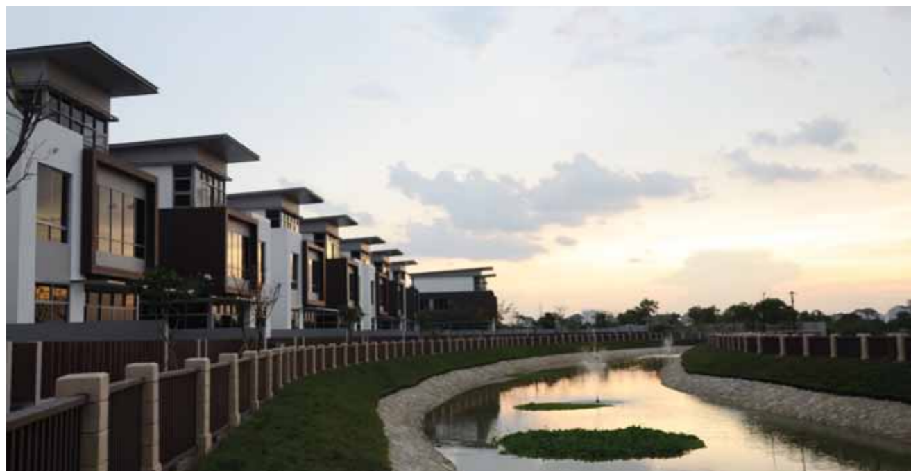
Khu biệt thự ven sông