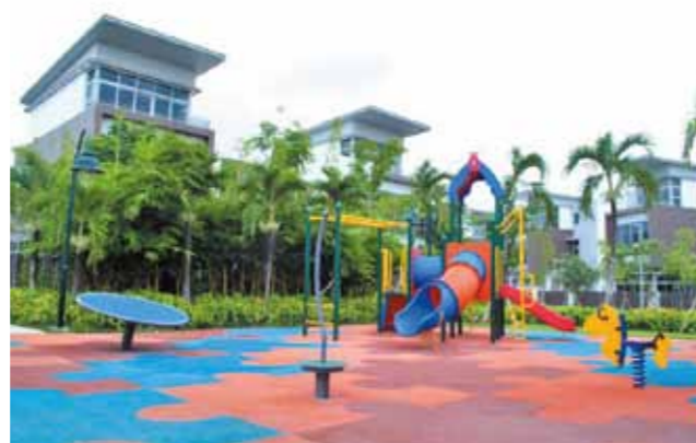
Sân chơi trẻ em