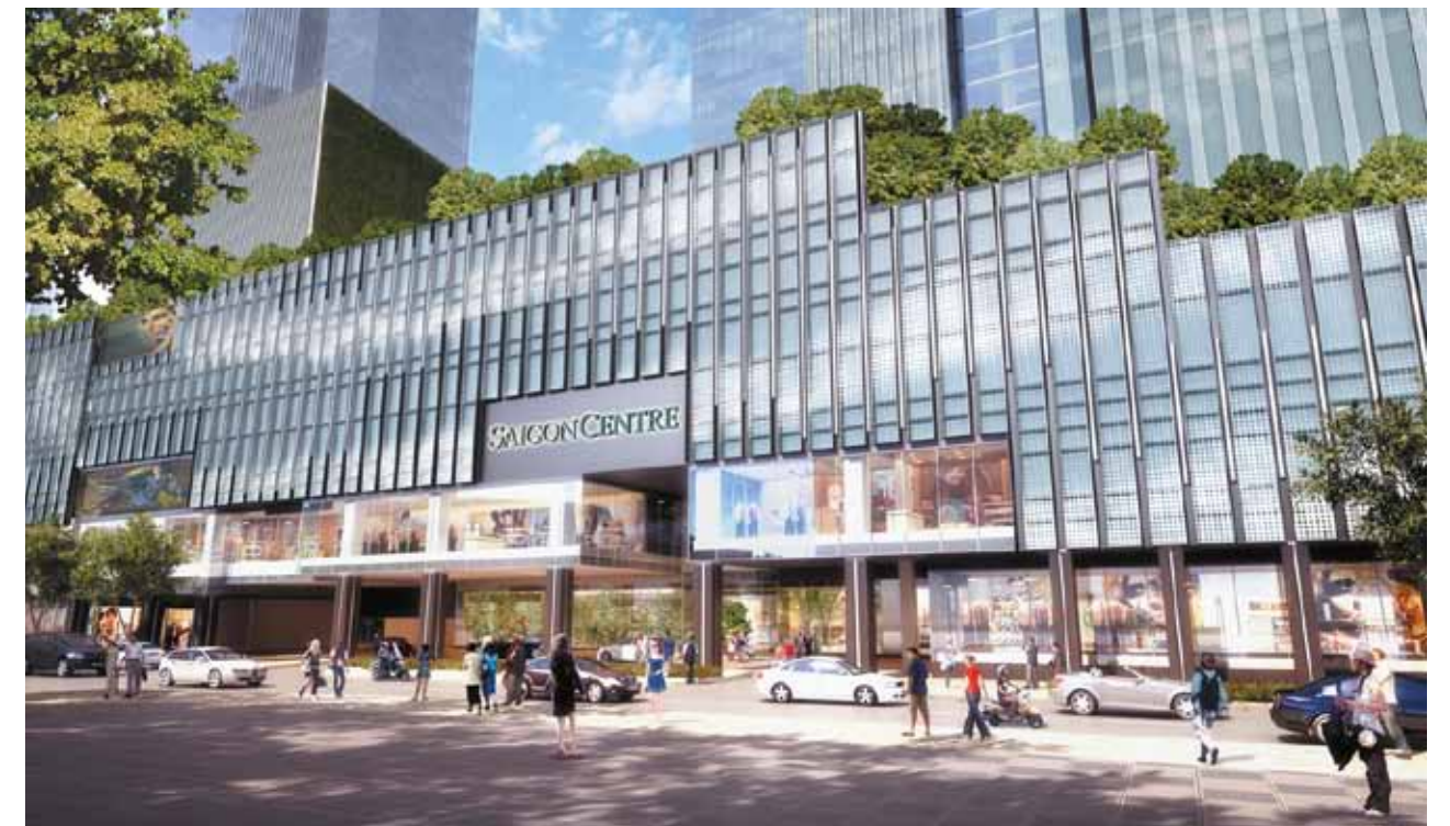
Phối cảnh dự án Saigon Centre (giai đoạn 2)