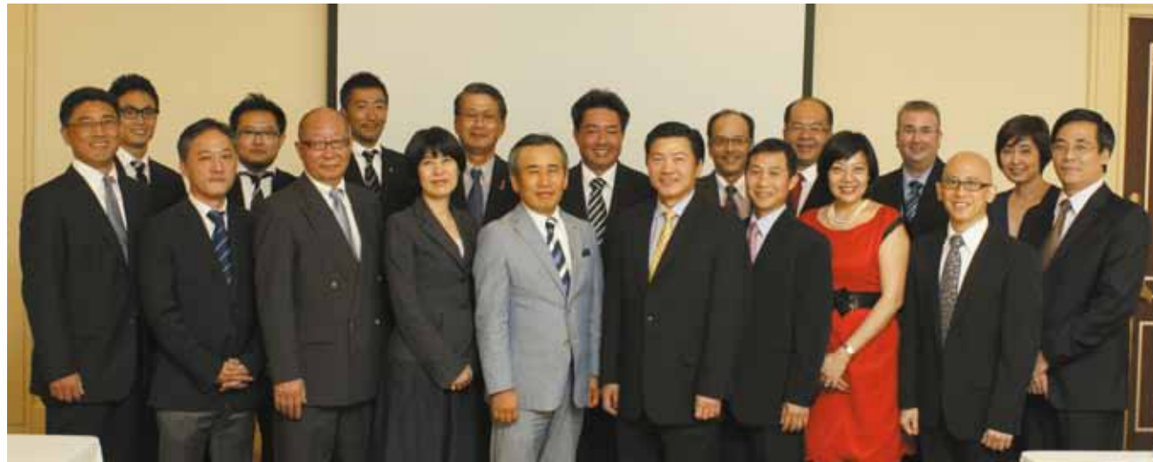
Hội đồng quản trị của Takashimaya, Toshin và Keppel Land WATCO