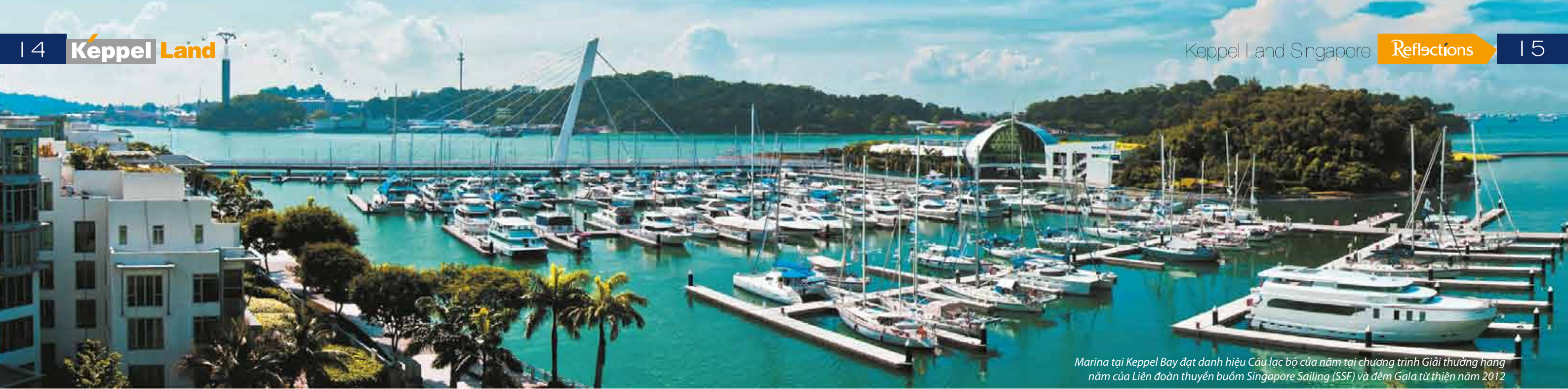
Marina tại Keppel Bay đạt danh hiệu Cầu lạc bộ của năm tại chương trình Giải thưởng hàng năm của Liên đoàn thuyền buồm Singapore Sailing (SSF) và đêm Gala từ thiện năm 2012

triển và xây dựng, về việc đảm bảo quyền và lợi ích của cộng đồng và các tác động có liên quan đến môi trường, cũng như khả năng tài chính và tiếp thị đặc biệt xuất sắc. Đây là giải thưởng đề cao các doanh nghiệp chủ chốt trong lĩnh vực xây dựng và tôn vinh các chủ đầu tư và công ty kiến trúc hàng đầu trong khu vực Đông Nam Á. Giải thưởng được trao cho các công ty có ảnh hưởng lớn đối với môi trường xây dựng tương lai, giúp thị trường hiểu rõ hơn vai trò quan trọng của những công ty này và ảnh hưởng của họ, cả về mặt xã hội và môi trường.