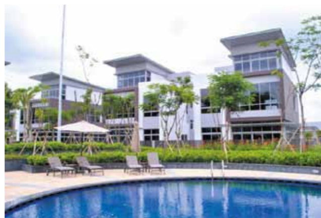
Khu biệt thự gần hồ bơi

Văn phòng kinh doanh dự án Riviera Cove Phòng 6, Lầu 7, Saigon Centre 65 Lê Lợi, Quận 1, Tp.HCM Tel: (848) 38 989 999 - Fax: (848) 39 144 553 Email: info@rivieracove.com.vn - www.rivieracove.com.vn