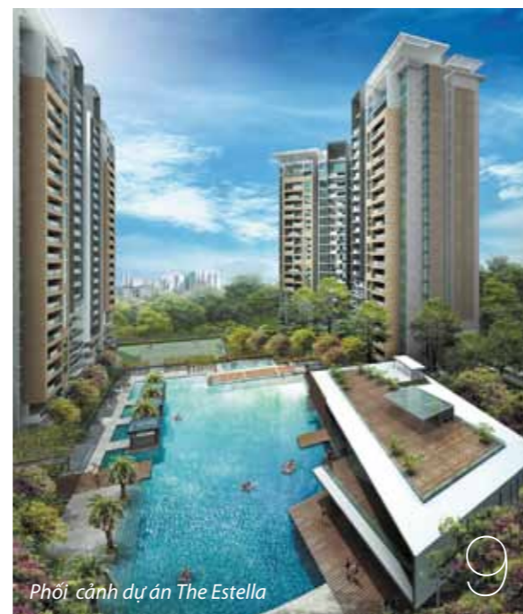
Phối cảnh dự án The Estella