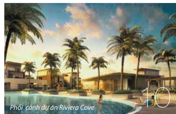
Phối cảnh dự án Riviera Cove