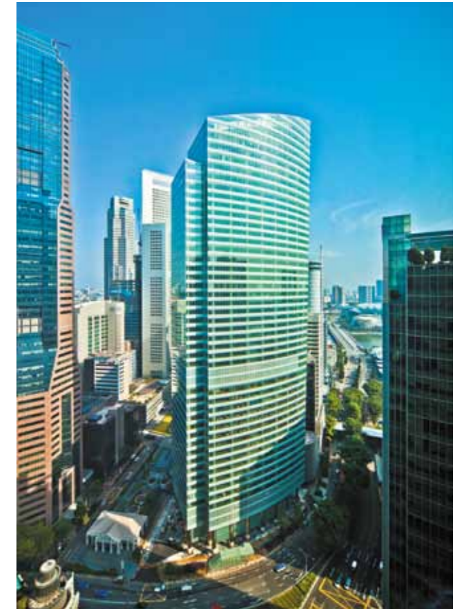
Ocean Financial Centre đạt được đánh giá 5 sao - số điểm cao nhất trong ba hạng mục của Giải thưởng Bất động sản quốc tế 2012

Tòa tháp văn phòng Hạng A cao 43 tầng này đã được trao tặng Giải thưởng Trung tâm thương mại cao tầng tốt nhất, Dự án cao ốc văn phòng tốt nhất và Kiến trúc cao ốc văn phòng tốt nhất tại khu vực Châu Á Thái Bình Dương. Dự án Riviera Point tại Quận 7, Tp. Hồ Chí Minh cũng đã được tuyên dương xuất sắc cho hạng mục "Dự án phức hợp" tại Việt Nam tại giải thưởng này.