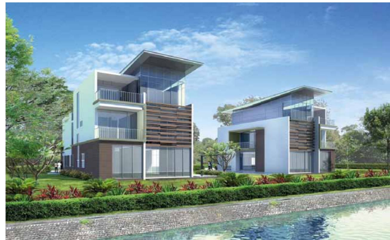
Phối cảnh biệt thự tại dự án

Nối tiếp thành công của dự án Riviera Cove, Quận 9, Tp. Hồ Chí Minh, Keppel Land đang chuẩn bị giới thiệu dự án biệt thự khác cũng tại Quận 9, tọa lạc tại phường Phú Hữu. Dự án này bao gồm 131 biệt thự cao cấp trải dài trên diện tích rộng 9,8 ha.